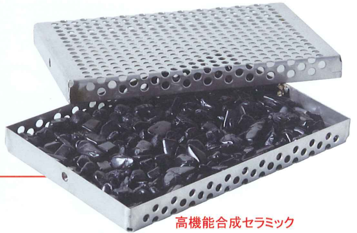
高性能合成セラミック

高品質セラミックをフライヤー内とオイルタンク中に配置して常に油の酸化を抑制します。